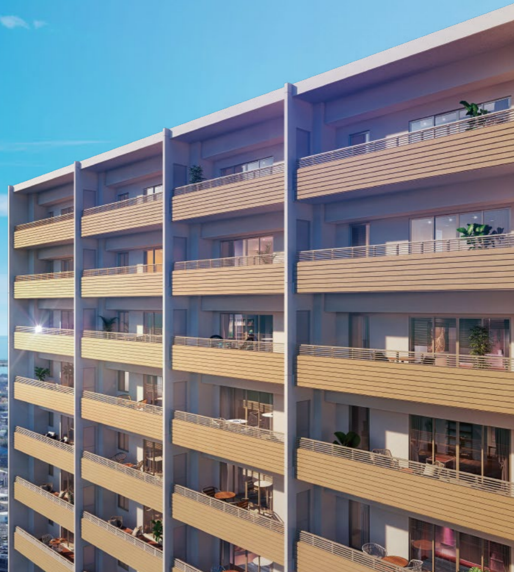
※外観完成予想図/この絵図は図面を元に描き起こした物で実際とは異なります。※眺望写真は2024年1月17日に撮影。一部CG処理を施しております。